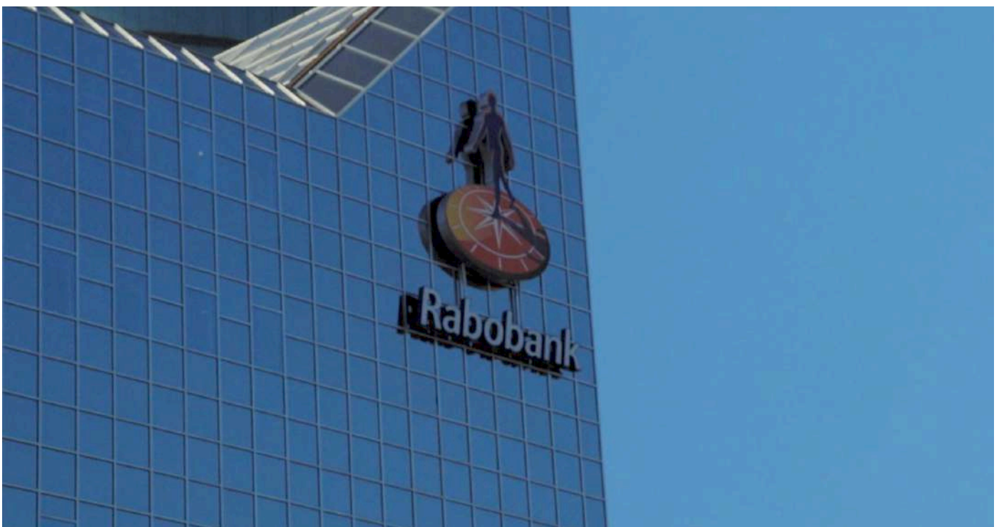
Foto: Rabobanks hoofdkantoor van spiegelglas, toegerust met met twee imponerende torens, is een treffend symbool voor het beleid van de bank: een luchtkasteel.