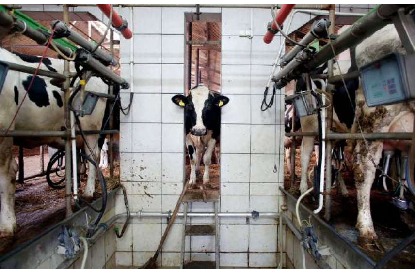
Foto: Stalen barrières, betonnen vloeren, betegelde muren en geautomatiseerde systemen maken een belangrijk deel uit van de leefomgeving van de moderne melkveestapel.

Kort samengevat: op papier zegt Rabobank dat haar klanten dierenwelzijn waarborgen, maar in de praktijk zijn die klanten betrokken bij vele vormen van grootschalig dierenleed, waaronder de meest verschrikkelijke uitwassen van de vee-industrie. Bovendien kan Rabobank geen enkel bewijs overleggen dat haar beleid buiten Nederland de afgelopen zes jaar ook maar enige dierenwelzijnsvoortgang van betekenis heeft opgeleverd als het gaat om zaken als het stoppen met legbatterijen en het opsluiten van varkens in kooien.