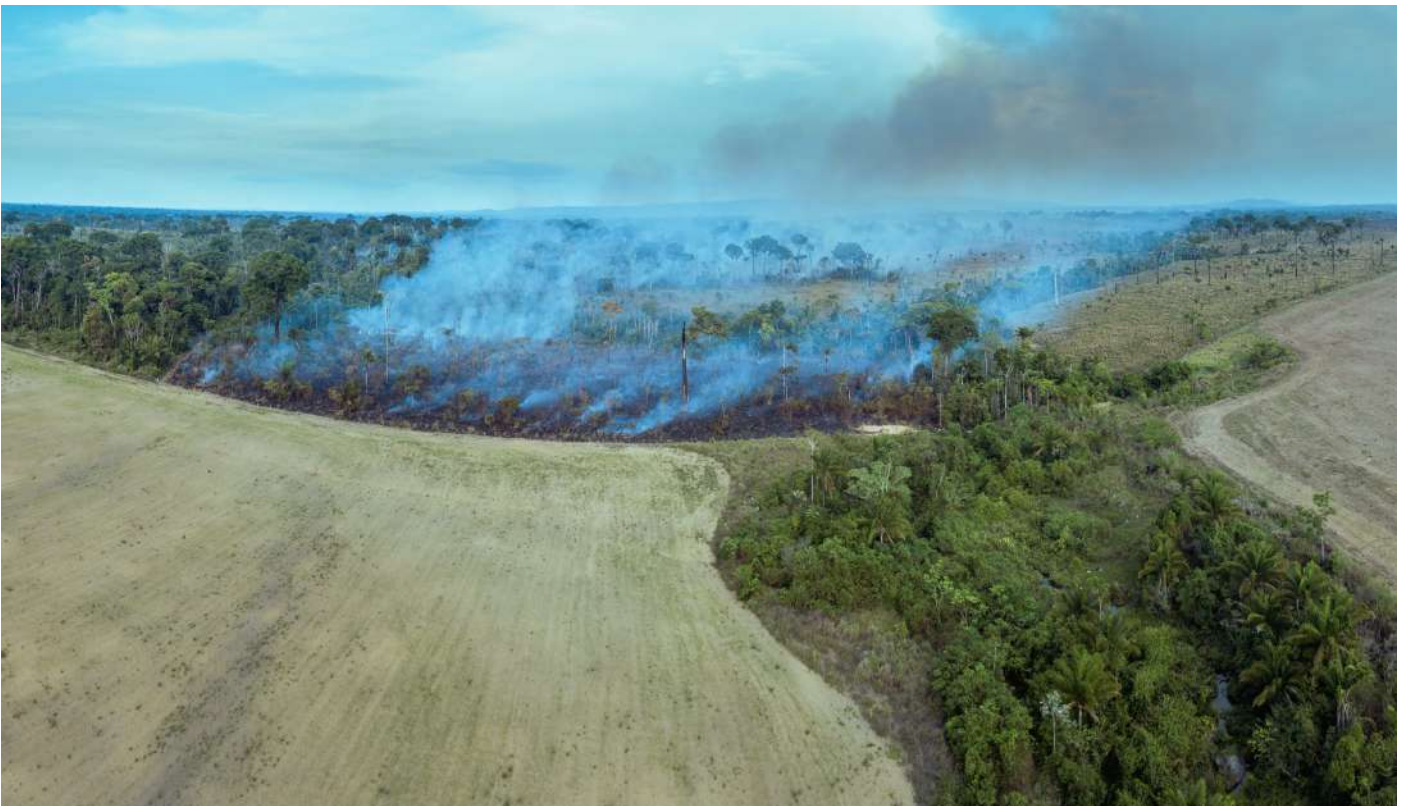
Foto: Ontbossing in het Amazonewoud - vrijwel altijd illegaal - vindt voornamelijk plaats ten behoeve van vleesproductie.